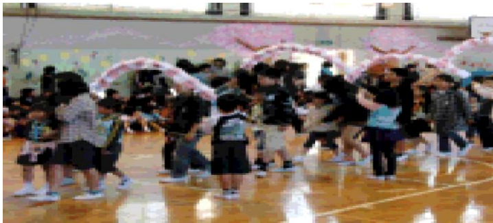
一年生を迎える会 (4/28)

社会に通用する人間となるための 基礎づくりとしての明神小教育を 推進するための 4つの柱と8つの重点施策！！